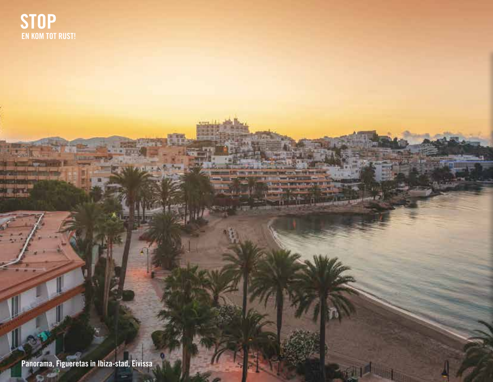
Panorama, Figueretas in Ibiza-stad, Eivissa