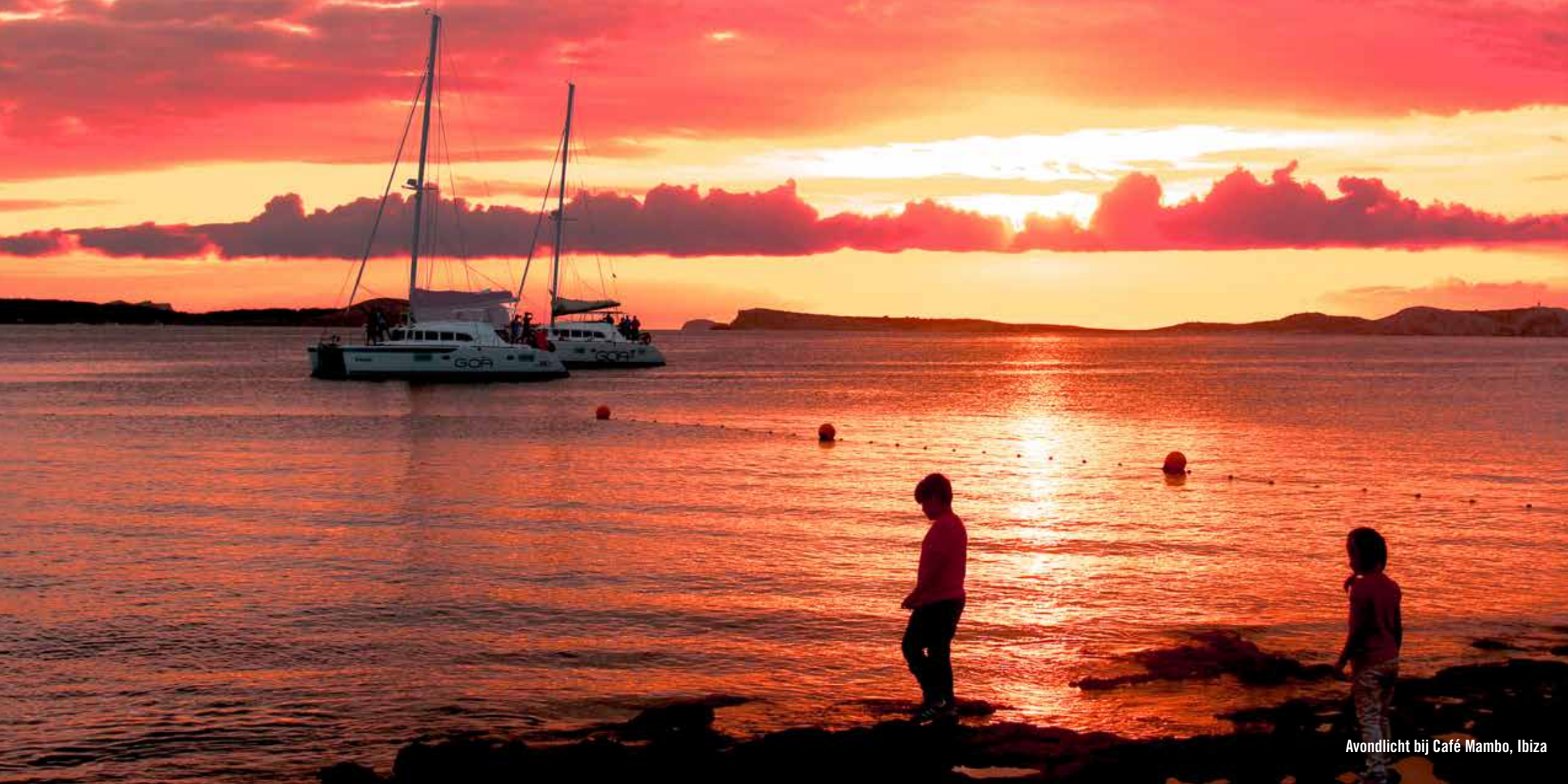
Avondlicht bij Café Mambo, Ibiza